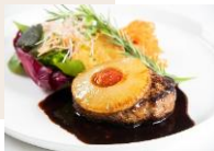
ハンバーグ焼パイナップル添え —デミグラスソース&トマトソース— ¥1,300

セピアのデミグラスソース コクがあり、ほんりの香みを感じるのがセピアのデミグラスソースの特長！ 必ずしも野菜をじっくりと時間をかけて煮込み、美味しくを堪能したセピア特製のデミグラスソースです。