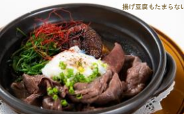
国産牛のすき焼き～セピア風～ (パンまたはライス付き) ¥2,200