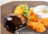
ハンバーグ&牡蠣フライ —デミグラスソース— ¥1,800